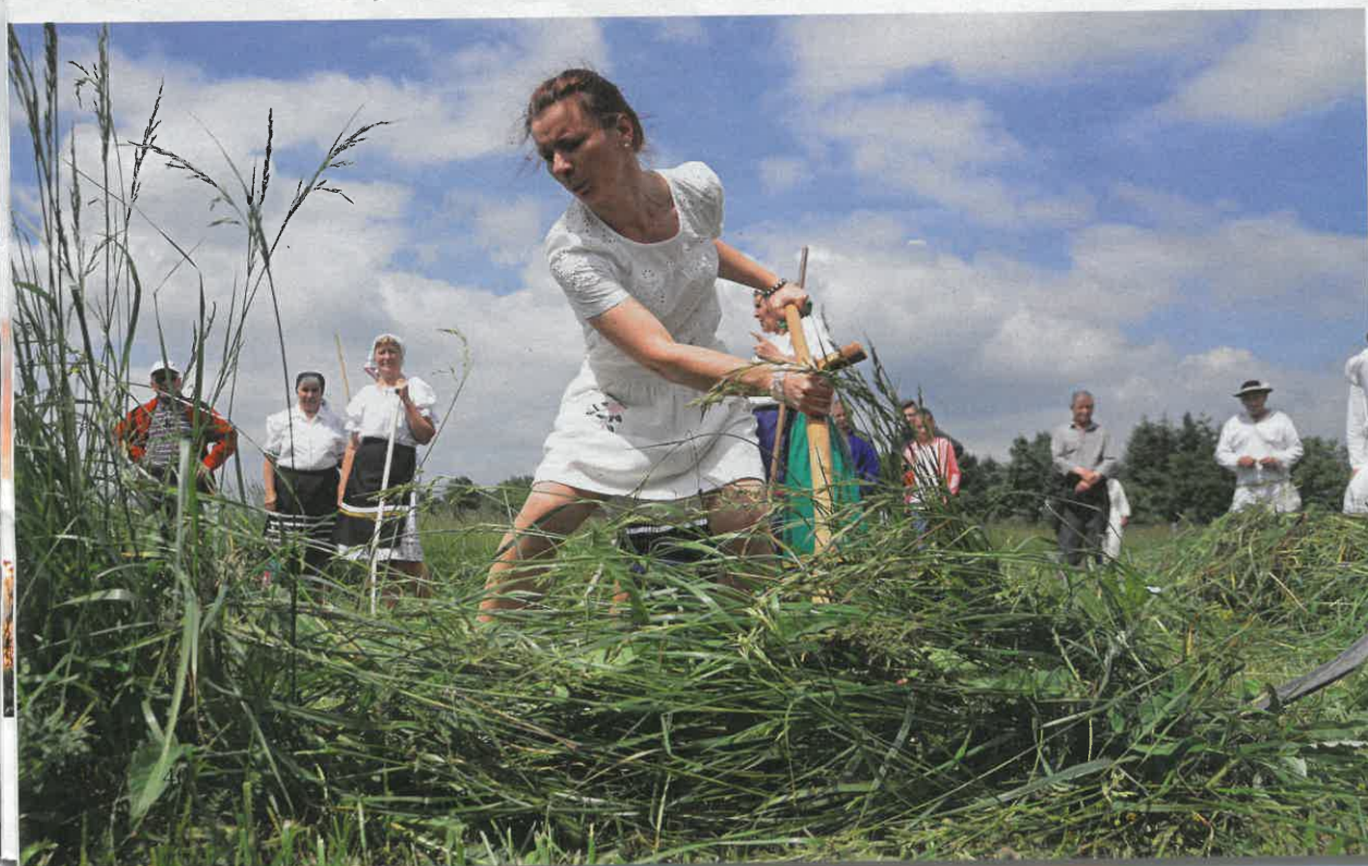
◀ Na pretekoch kosia aj ženy a mnohé z nich konkurujú mužom.