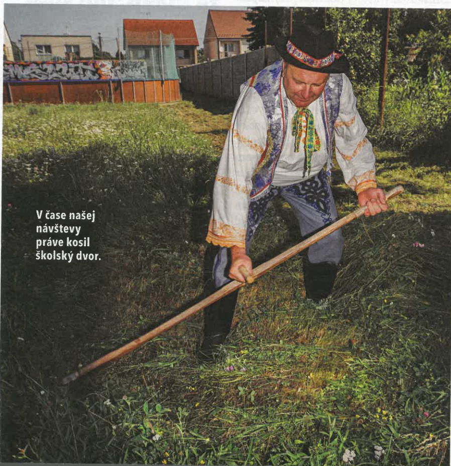
V čase našej návštevy práve kosil školský dvor.

Keď som sa prebral, prišla ma primárka skritizovať, že som bol jeden z extrém-